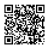
富邦產險 旅遊小管家專區