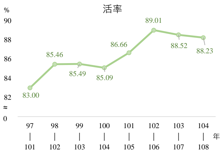
圖3、近年臺中市女性罹患乳癌5年相對存

局持續辦理乳攝篩檢推廣活動，鼓勵婦女持續每兩年定期接受乳房 X 光攝影檢查，及早發現，把握黃金時間，配合專業醫師的治療，大幅增加乳癌治癒率(圖 3)。