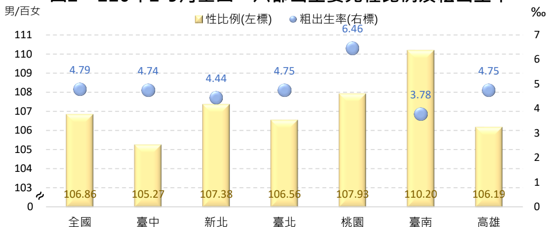
圖 2、110 年 1-9 月全國、六都出生嬰兒性比例及粗出生率

與其他五都相較，本市 110 年 1-9 月粗出生率 4.74‰，略低於全國之 4.79‰，於六都中排名第 4，僅高於臺南市 3.78‰及新北市 4.44‰；在出生嬰兒性比例方面，本市為 105.27，低於全國平均 106.86，亦於六都中最低(詳圖 2)。