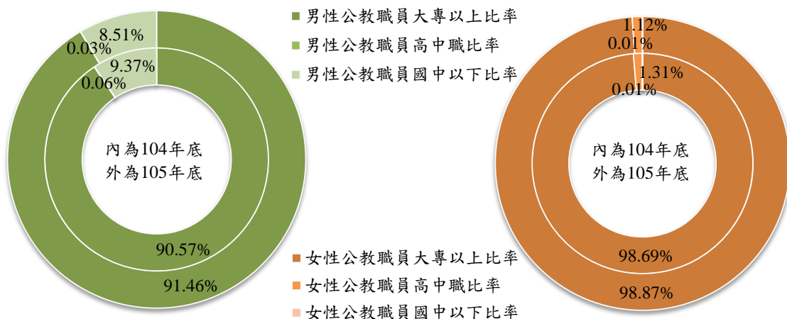
圖三 公教職員教育程度結構

本市 105 年男性大專以上教育程度公教職員占男性公教職員 91.46%(1 萬 3,174 人)，較 104 年底增加 0.89 個百分點，高中職占 8.51%(1,226 人)，減 0.86 個百分點，國中以下占 0.03%(4 人)，減 0.03 個百分點；女性大專以上教育程度占女性公教職員 98.87%(1 萬 8,897 人)，較 104 年底增加 0.18 個百分點，高中職占 1.12%(215 人)，減 0.19 個百分點，國中以下占 0.01%(1 人)；兩性教育程度為大專以上人數所占比例，均為歷年最高。(圖三)