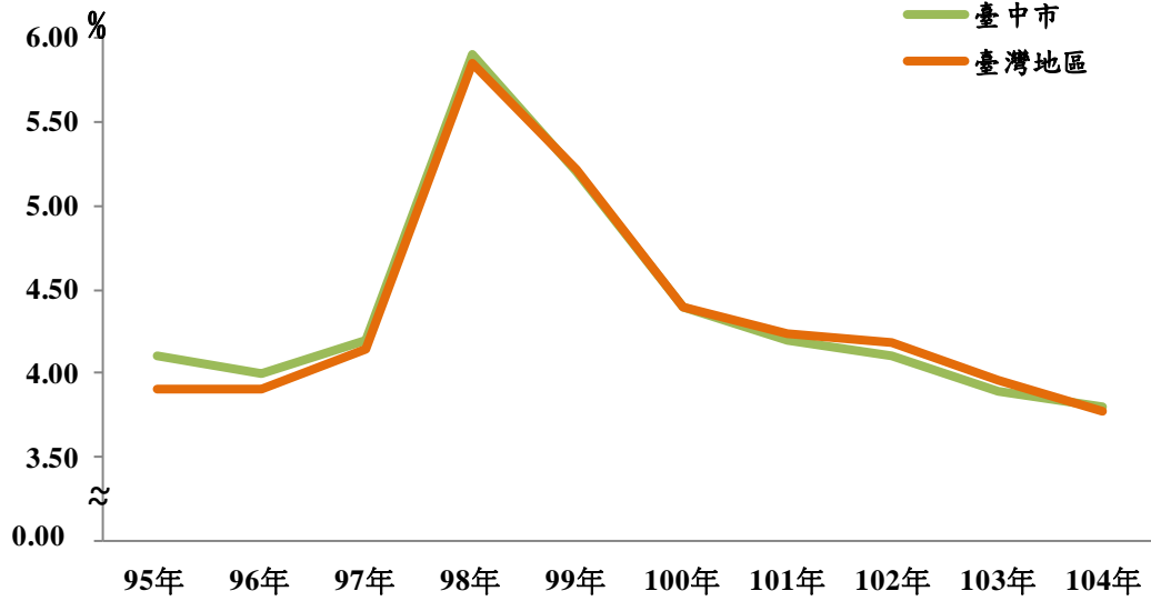
圖 3 104 年六都失業率比較